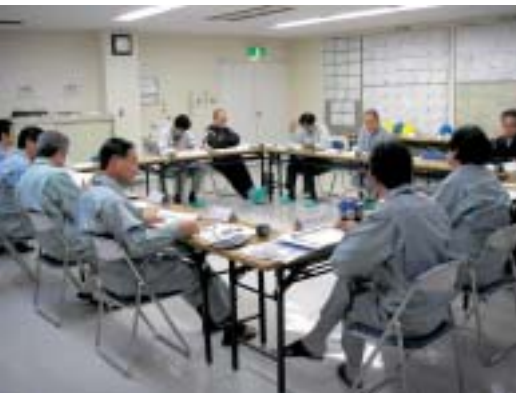
清掃センター更新計画等検討委員会作業部会を開催