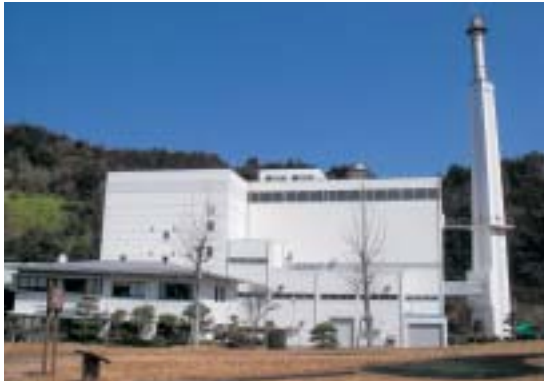
日向東臼杵南部広域連合清掃センター