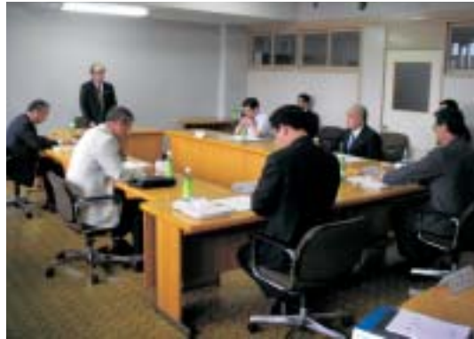
正副広域連合長会議を開催