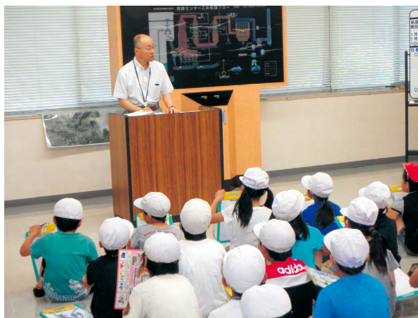
施設の説明を受ける子どもたち