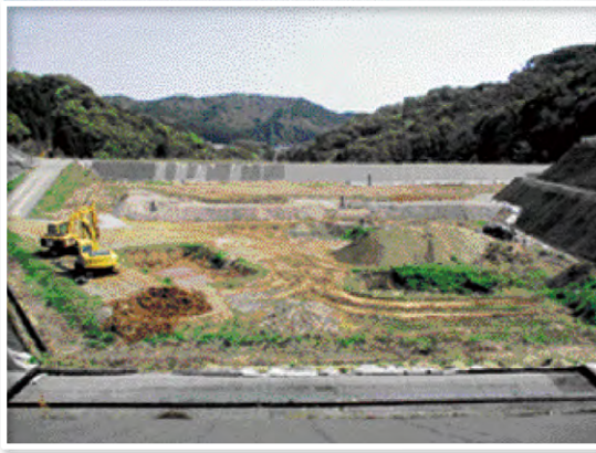
▲日向市一般廃棄物最終処分場 令和13年度中に満杯になる予定です