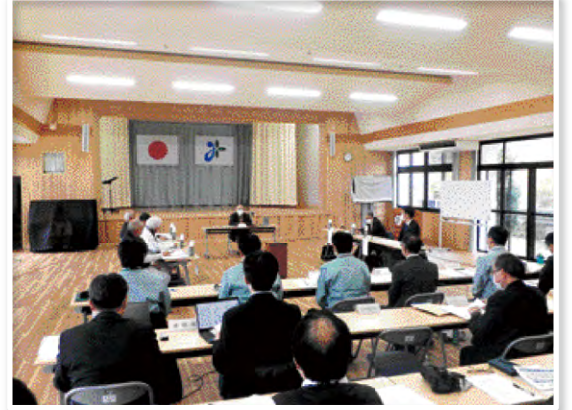
▲第1回建設検討委員会の様子